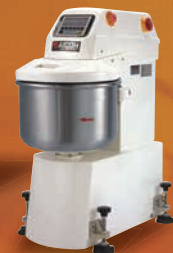
スパイラルミキサー