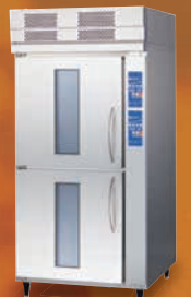
ドックコンディショナー